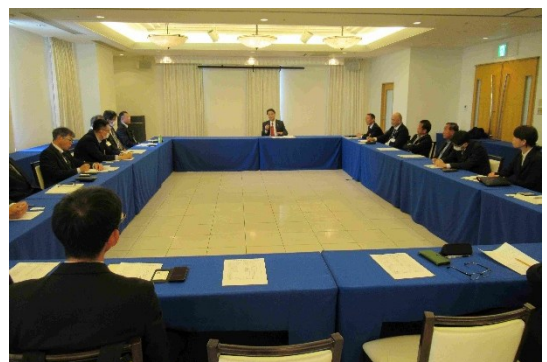
進藤顧問と土地改良区職員との意見交換