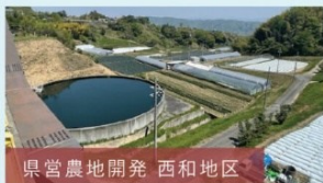
県営農地開発 西和地区