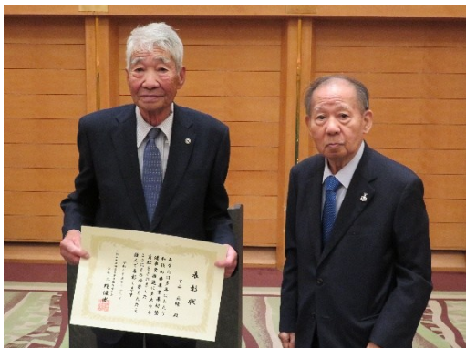
中山前副会長の功労者表彰

土里ネット会長会議顧問と別室において土地改良区職員等との意見交換会が開催され、土地改良区の基盤強化について活発な意見交換が行われました。